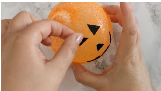
Coller les yeux, le nez et la bouche sur le photophore