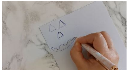
Dessiner les yeux, le nez et la bouche sur la feuille cartonnée découper