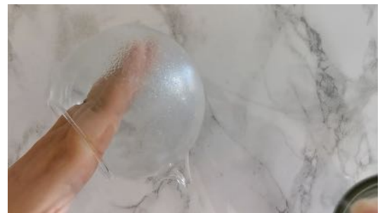
Pulvériser la colle sur le photophore