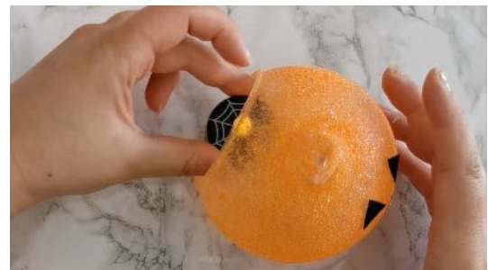
Placer la bougie LED dans le photophore