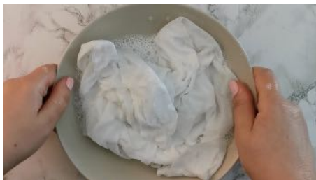
Imbiber le tissu du mélange