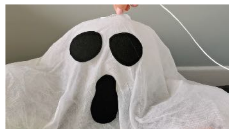
Coller la ficelle sur le haut du fantôme