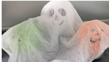
Placer le tissu sur les ballons Laisser sécher au moins 6 heures