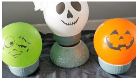
Gonfler les ballons, les scotcher dans des bols