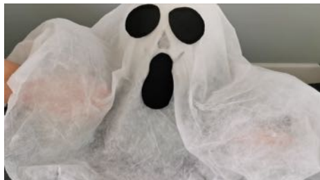
Percer les ballons