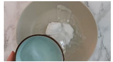
Mélanger une cuillère de colle avec un peu d'eau