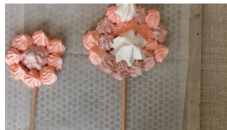
Pocher différentes formes les unes autour des autres