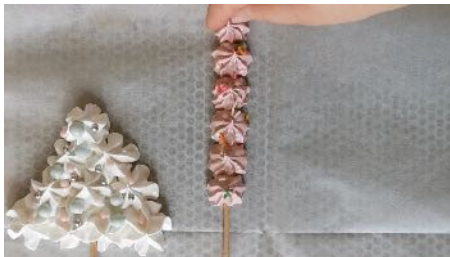
Pocher une rangée Ajouter des vermicelles