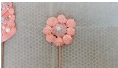
Pocher une forme de fleur Ajouter une perle en sucre au centre