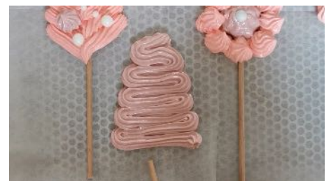
Pocher un serpent