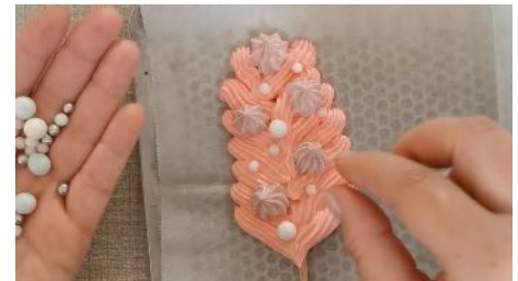
Pocher des épis Pocher par dessus des petites pointes Ajouter des perles en sucre