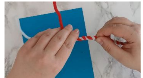
Torsader 2 fils chenilles un rouge et un blanc