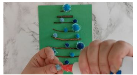
Coller les bouts de bois Coller des pompons