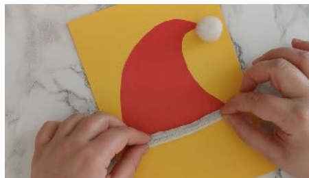
Coller un pompon et un fil chenille sur le bonnet