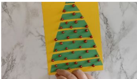
Coller les bandes en les espaçant Coller des boules rouges