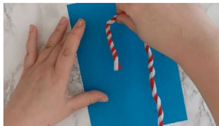
Former une canne de Noël Coller sur une feuille