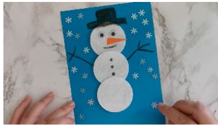
Coller les 3 cotons, dessiner les éléments, coller les flocons