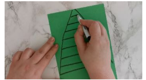
Dessiner un grand triangle Découper les bandes