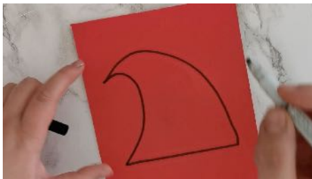
Dessiner une forme de bonnet Découper, coller sur une feuille