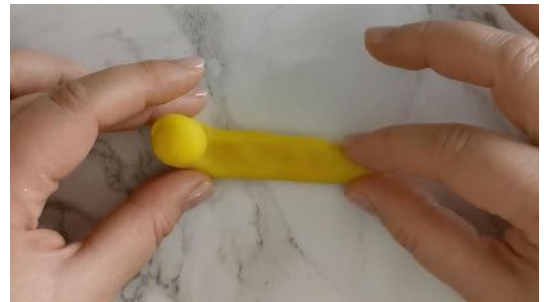
Modeler le corps de l'escargot En réalisant un petit boudin jaune