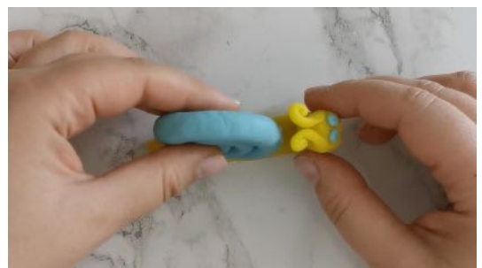
Placer la spirale sur le dos de l'escargot