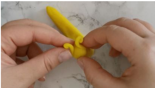
Réaliser de petites antennes, les placer sur la tête de l'escargot