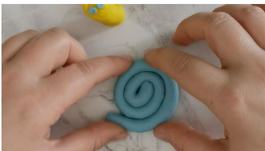
Former une spirale bleue