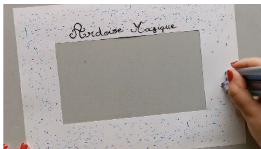
Écrire ardoise magique, faire plein de petits points de couleur pour décorer