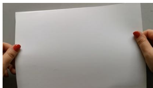
Coller la seconde feuille au dos de l'ardoise