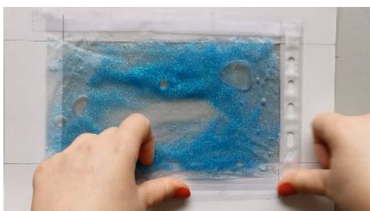
Scotcher la pochette au dos de la feuille