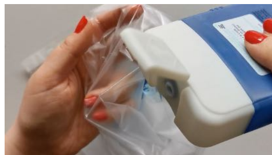
Verser du gel douche dans la pochette plastique, couper la pochette à la moitié