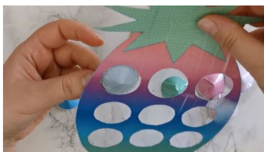
Coller les bulles au dos de l'ananas