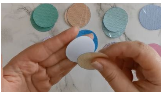
Coller les ronds ensemble par couleurs identiques