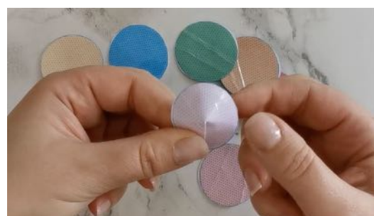
Cranter les ronds, superposer les parties l'une sur l'autre et coller