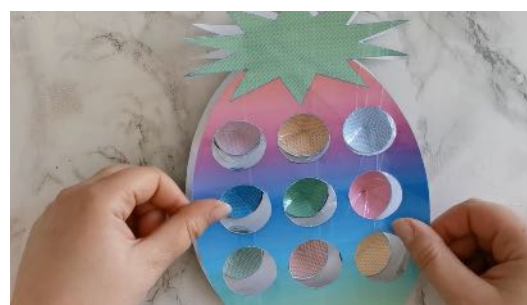
Coller l'autre ananas au dos du 1 er pour recouvrir le tout