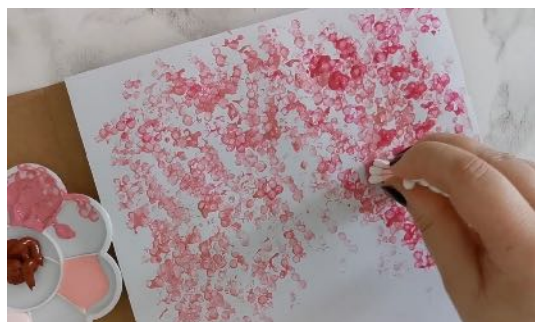
Tamponner avec une 1ère couleur, puis superposer les différentes couleurs