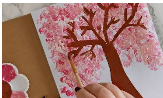
Peindre les branches de l'arbre