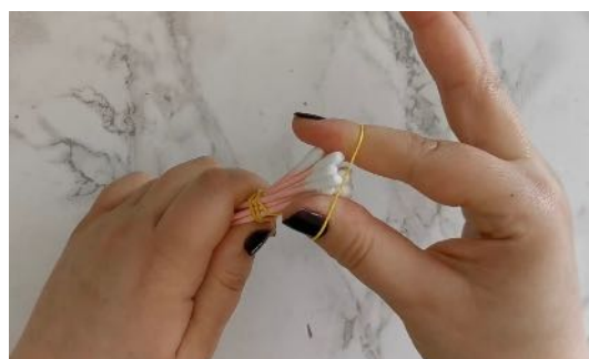
Rassembler les cotons-tiges, les faire tenir ensemble avec l'élastique