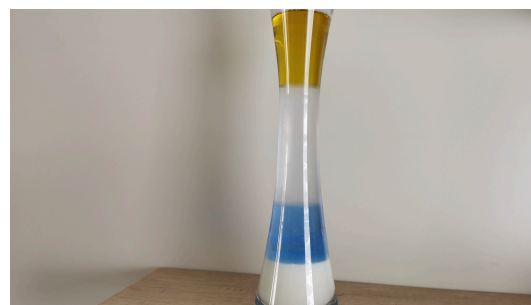
Étudier le résultat, les liquides ne se mélangent pas