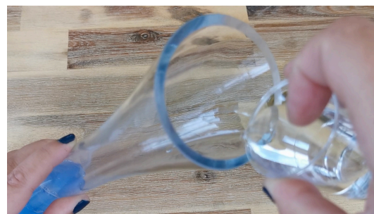
Verser doucement l'eau