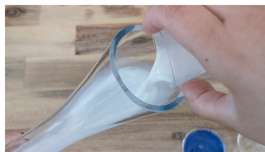
Verser le lait dans le vase