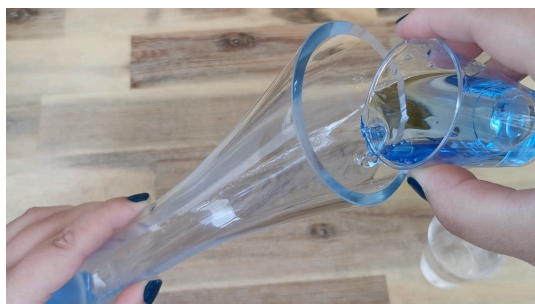
Verser doucement le liquide vaisselle