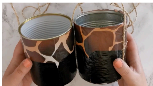
Réaliser une seconde échasse