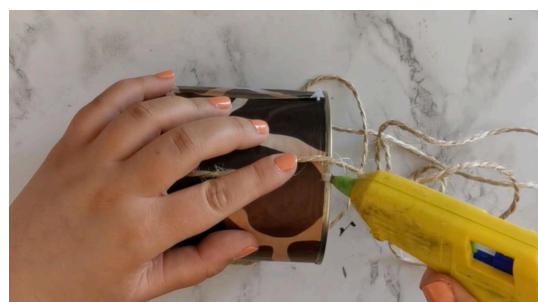
Coller la ficelle sur la boîte de conserve