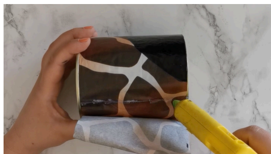
Coller la feuille sur la boîte de conserve