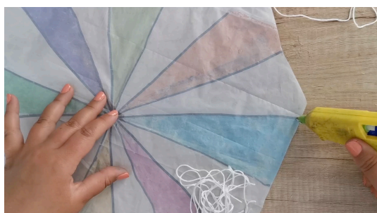
Découper des bouts de ficelle les coller autour du parachute