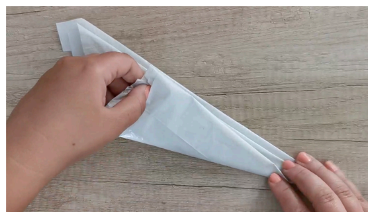
Découper le sac poubelle, l'ouvrir puis le plier en triangle