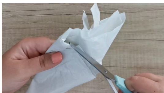
Découper l'excédent du triangle pour obtenir un cercle