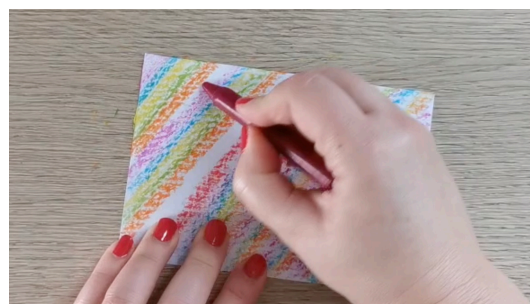
Colorier la feuille cartonnée avec les pastels en mélangeant les couleurs