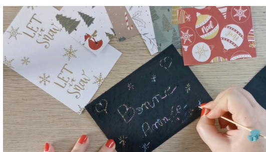
Ecrire les vœux de bonne année