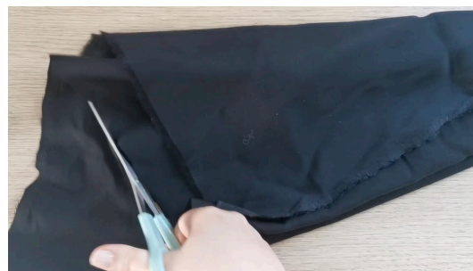
Plier le tissu, couper les extrémités pour obtenir un demi-cercle