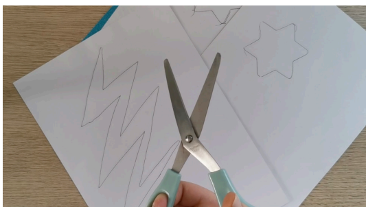
Dessiner les étoiles sur les feuilles ainsi qu'un éclair, découper