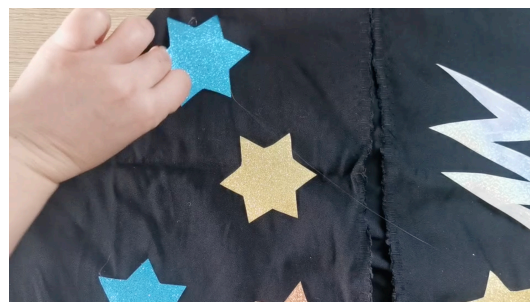
Coller les étoiles et l'éclair sur la cape