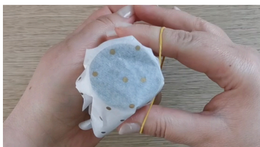
Placer le papier de soie à l'extrémité du rouleau, le maintenir avec un élastique