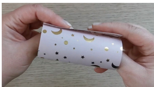
Coller la feuille autour du rouleau de papier toilette