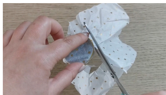
Couper le surplus de papier de soie