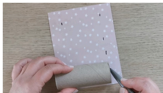
Découper la feuille à la taille du rouleau de papier de toilette